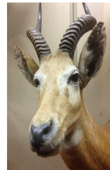
Impressies van het museum van vòòr de renovatie (2013).