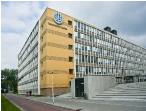
De locatie van het seminar: het Pieter de la Court-gebouw (Wassenaarseweg 52, Leiden).