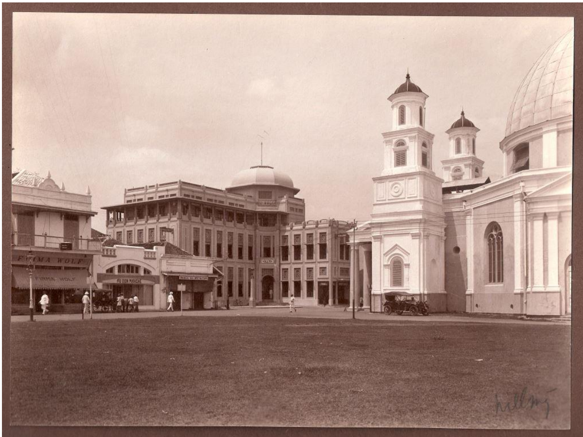
Semarang, kantoor Nilmij