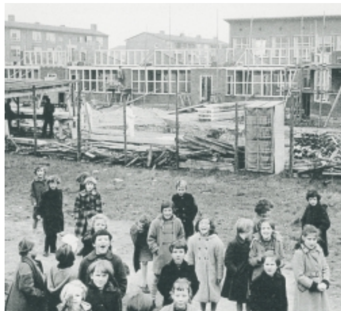
Naoorlogse wijk in aanbouw in Venlo

De brochure 'De naoorlogse wijk in historisch perspectief: de praktijk' is te bestellen bij Hilde van Meeteren, 030 · 69 83 312