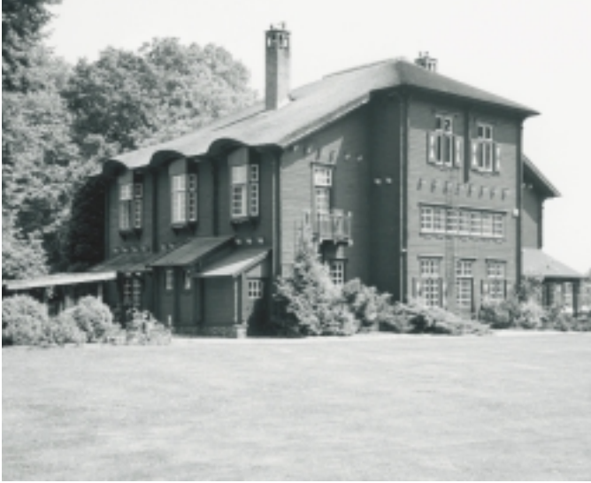
De Hermanshoeve op landgoed de EESE in Eesveen, gemeente Steenwijk, is gebouwd rond 1917. Het is is een fraai voorbeeld van een houten huis dat vervaardigd is van een uit Scandinavië afkomstig bouwpakket

Tussen ruwweg 1850 en 1940 doet een nieuw type huis zijn intrede in Nederland: een houten huis, dat als bouwpakket wordt aangeleverd. Anders dan bij de bekende houten huizen uit onder meer de Zaanstreek gaat het hier niet om houtskeletbouw, maar om zogenaamde blokhuizen: huizen opgetrokken uit gekantrechte balken, die op elkaar gestapeld worden. De twee bekendste leveranciers zijn de Noorse Strømmen Trævarefabrik A/S in Strømmen en het Duitse Christoph & Unmack AG in Niesky. In eerste instantie werden relatief kleine huizen besteld, die dienden als vakantiehuisen. Later verschijnen er ook grotere types, bestemd voor permanente bewoning. De houtbouw was een relatief goedkoop alternatief voor de steenbouw, ondanks het feit dat de bouwpakketten uit het buitenland moesten worden aangevoerd. Zo is in Leeuwarden een rij houten woningen gebouwd in een periode dat de baksteen duur was en het optrekken van geïmporteerde blokhuizen goedkoper bleek.