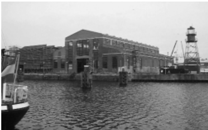
De Oude Rijkswerf Willemsoord werd door Napoleon ook wel het 'Gibraltar van het Noorden' genoemd

Op donderdag 27 juni wordt de cursus 'Herbestemming van monumentale complexen' door de RDMZ gegeven in samenwerking met het NRF en NCM. Centraal op deze cursusdag staat de herbestemming van de Oude Rijkswerf Willemsoord, onderdeel van de Stelling van Den Helder. Kenmerkend voor dit vroeg 19de-eeuwse complex, is de symmetrische opbouw met de as gericht op zee.