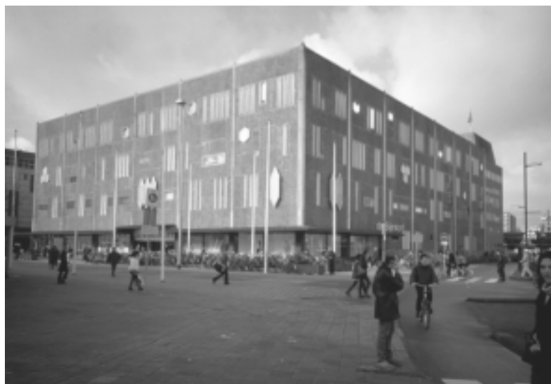
Wederopbouw in Eindhoven: de Bijenkorf aan het 18 september plein, ontworpen door de Italiaanse architect Gio Ponti

Vrijdag 1 maart vond voor de vierde keer het Landelijk Wederopbouwoverleg plaats. Op uitnodiging van de gemeente Eindhoven was het LWO te gast in de Witte Dame, de voormalige gloeilampen fabriek van Philips. Het programma voor de dag was opgezet door de gemeentelijke Monumenten Commissie, die de gelegenheid om het wederopbouwvergoed voor het voetlicht te brengen met enthousiasme heeft opgepakt. Centraal stond het centrum van Eindhoven, dat in de Tweede Wereldoorlog door diverse bombardementen werd getroffen. Een overzicht van de wederopbouwplannen en de uiteindelijke uitvoering van de wederopbouw gaf een goed inzicht in de huidige verschijningsvorm van de stad.