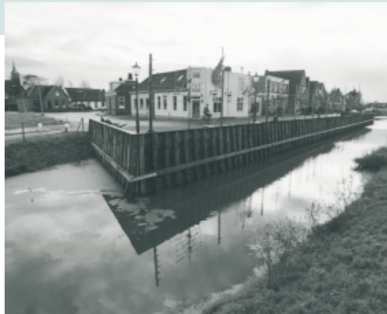
De CV voor Zoutkamp liet zien waar de militaire, waterstaatkundige en vissersdorpenmerken nog aanwezig zijn. Op basis hiervan werd de nieuwe begrenzing voor de bebouwde kom bepaald, waarbij het vroegere beloop van de vestinggracht en het bastion de inspiratie vormden

voor de door Oranjewoud voorgestelde ingrepen. Voor de ‘hervisualisering’ van de militaire functie werd door Oranjewoud voorgesteld de vroegere spuikom annex vestinggracht weer uit te graven. Daardoor kon tevens de contour van het vroegere bastion, rudimentair in rooijlijnen nog aanwezig, veel duidelijker in het dorpsbeeld terugkeren en kon het dorp aan die zijde weer een duidelijke begrenzing krijgen. In de CV is het weer uitgraven van de spuikom niet expliciet aanbevolen; wel zijn alle genoemde onderdelen (beloop van de vestingwal, ligging van het bastion, tracé van de gracht en de spuikom) als kenmerkende onderdelen van de plattegrond gekarteerd. De suggestie om van de dijk een (wandel)route door het dorp te maken, is eveneens overgenomen. In de CV wordt erkend dat verwezenlijking hiervan wellicht moeilijk zal verlopen omdat delen van de dijk op particuliere grond liggen. Het idee van een openbare (wandel)route idee stuitte bij degenen wier erf direct aan de dijk grenst inderdaad op weerstand: het zicht vanaf de dijk op de aangrenzende erven en in de daarop gelegen huizen werd als een te grote inbreuk op de privacy ervaren. Ook andere aanbevelingen zijn in meer of mindere mate overgenomen door het ingenieursbureau.